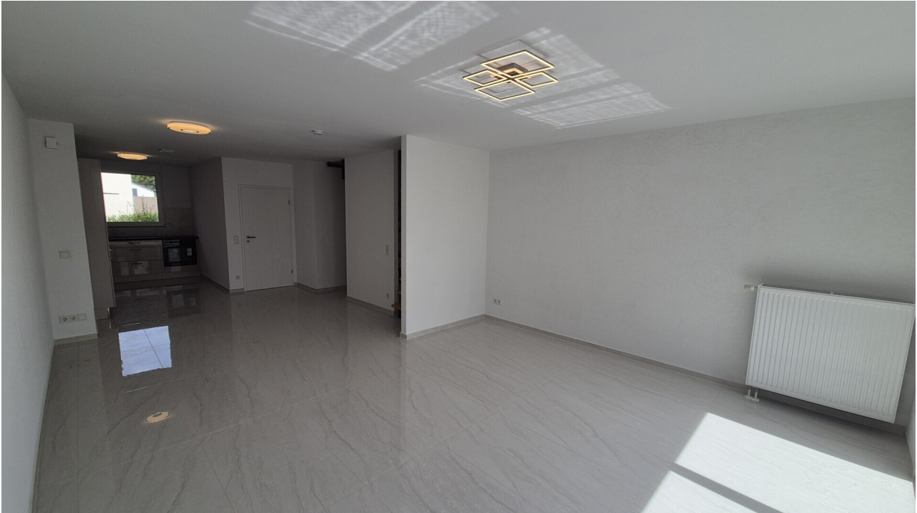
Wohn-Essbereich - EG