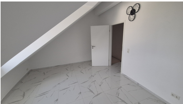
Zimmer 3 DG