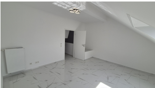
Zimmer 4 DG