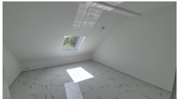
Zimmer 4 DG