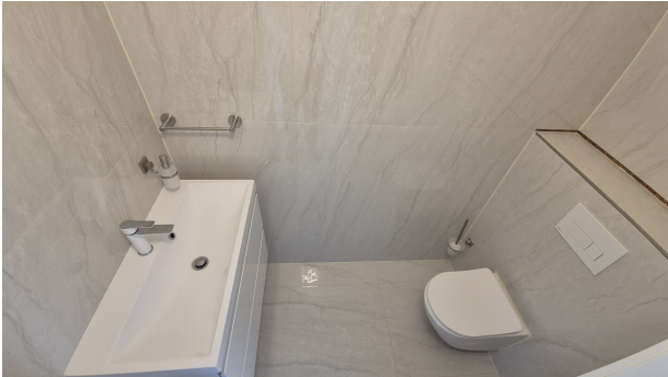
Gäste WC - EG