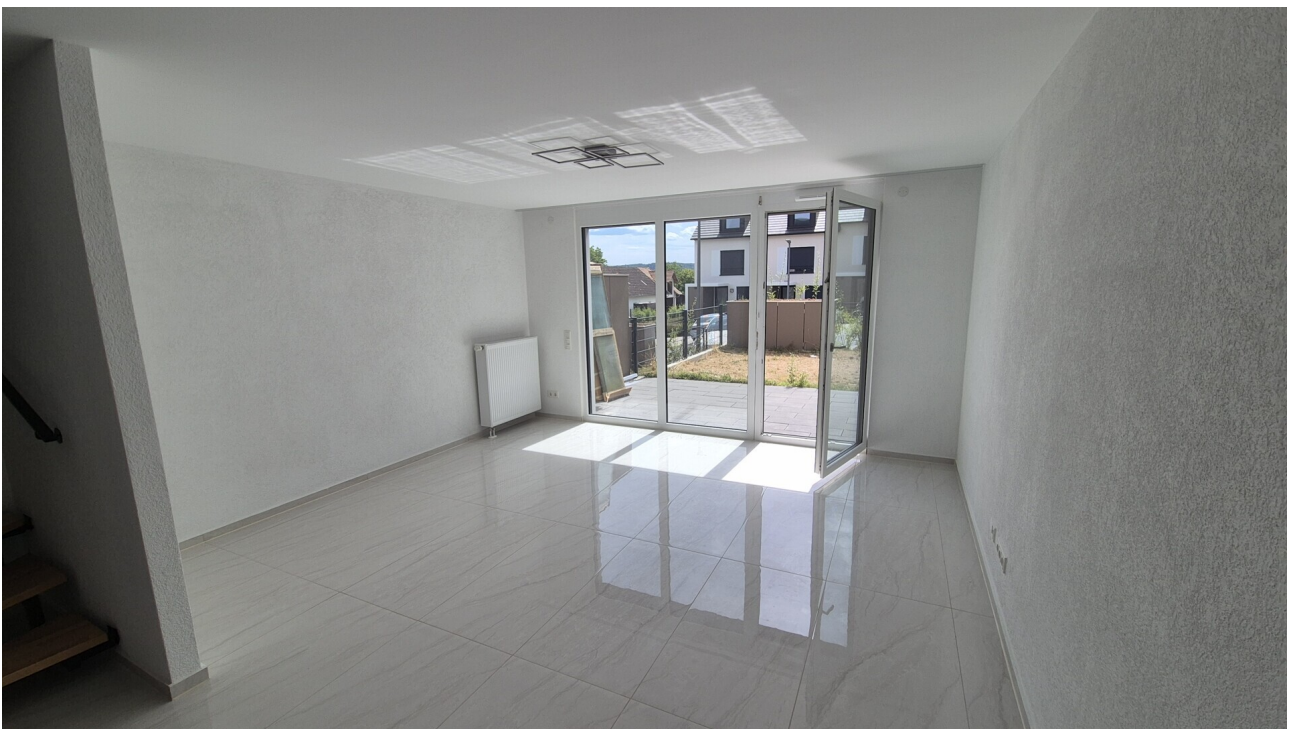
Wohn-Essbereich - EG