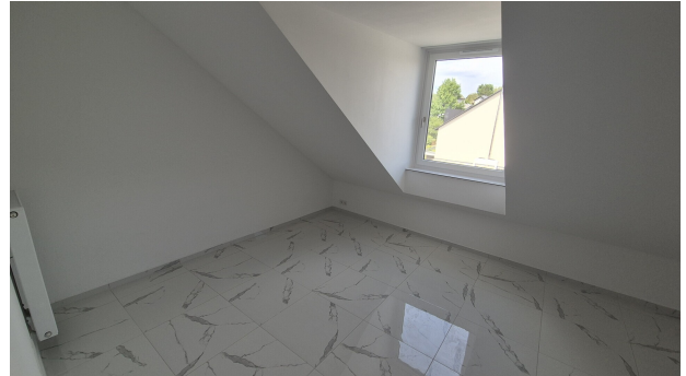
Zimmer 3 DG